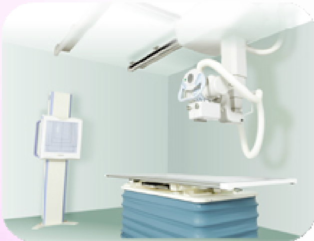
エックス線撮影装置 日立メディコ製